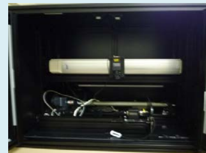
金属部品傷検査装置