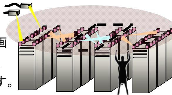
ワイヤレスインターコネク

IBM東京基礎研究所は東京大学社会連携講座に参画し、東京大学大学院工学系研究科、川崎市と連携し、ナノ・マイクロ技術を活用した共同研究を行っています。講座名は「省エネルギーを目指した、次世代ナノ・マイクロデバイスとシステム」。3次元積層デバイス、光インターコネク、ワイヤレス・インターコネクの技術をもとに、世界的な課題である省エネルギー化、循環型社会の構築に寄与する省エネルギー情報処理に関する研究・開発を行います。