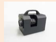
Dr.SPECKLE (スペックルコントラスト測定装置)

当社（株式会社オキサイド）久保田研究所及び先端レーザ&光学技術チーム(ALOT)では、これまで培ってきた光学材料及びレーザー等フォトンクス技術を更に磨き上げ、それらを駆使し技術コンサルティングや計測機器を顧客ニーズに沿って提供しております。想定顧客は、車載関連分野で、この市場で、エコ、安全、安心、快適なドライバー空間を実現するための先端計測機器及び光学デバイスの提供を目指しております。