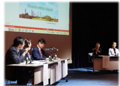
〈10月3日キックオフシンポジウムの様子〉