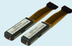
532-594 nm 小型可視レーザ