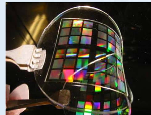
ナノインプリント転写・金型