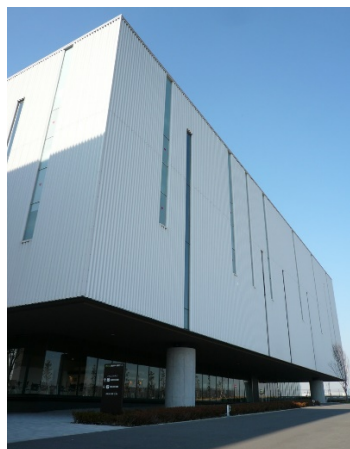
川崎生命科学・環境研究センター(LiSE)