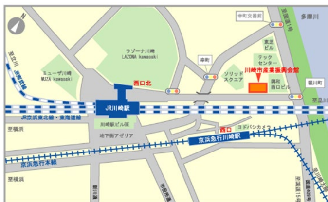
※当館をご利用の際は、電車、バスをご利用ください。JR川崎駅から徒歩8分、京浜急行川崎駅から徒歩7分