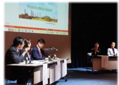
〈10月3日キックオフシンポジウムの様子〉